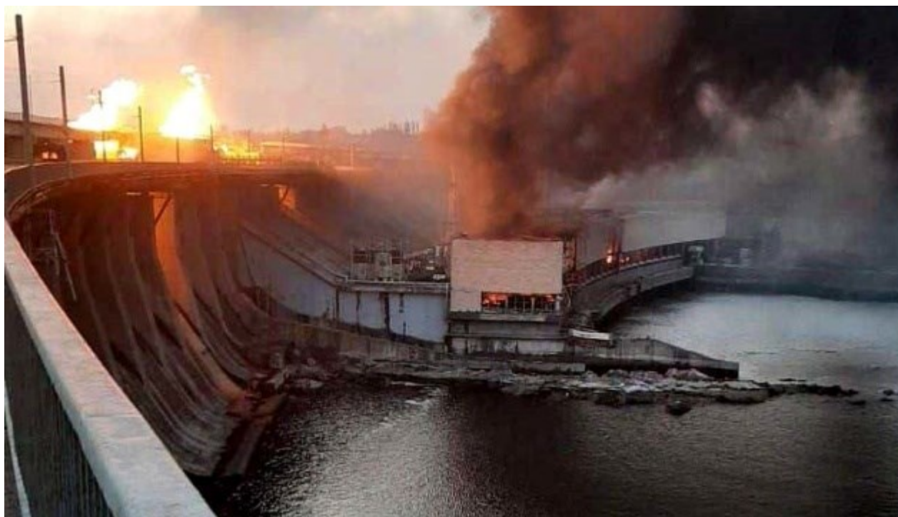
Consecuencia de los ataques rusos del 22 de marzo de 2024-Khmelnytskyi

El 22 de marzo, Rusia prosiguió su terrorismo de misiles, lanzando 60 UAV [vehículos aéreos no tripulados] y 90 misiles de diversos tipos, dirigidos contra instalaciones energéticas y zonas residenciales de ciudades. Se oyeron explosiones en al menos diez regiones: regiones de Khmelnytskyi, Lviv, Kharkiv, Zaporizhzhia, Dnipropetrovsk, Poltava, Ivano-Frankivsk, Kirovohrad, Sumy y Vinnytsia. Las Fuerzas Armadas rusas lanzaron hoy doce ataques con misiles contra Zaporizhzhia.