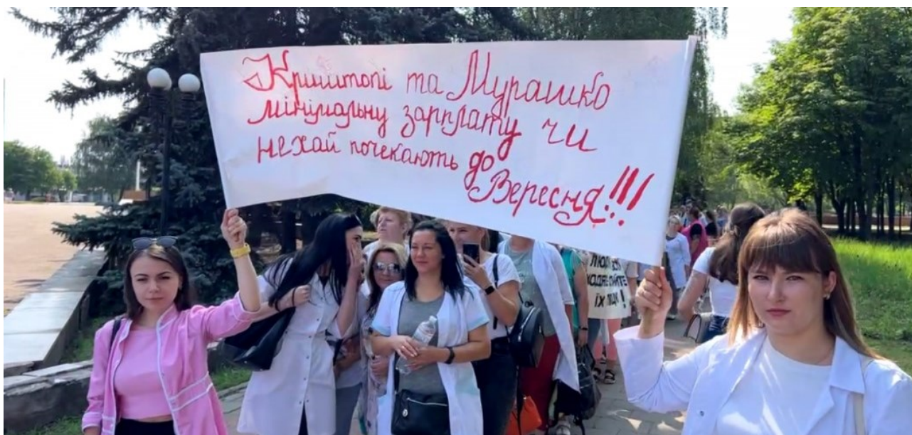
Manifestación por los salarios impagados de las enfermeras en Kriviy Rih, julio de 2023

Esta demanda de control social también está presente en otros sectores (véanse más adelante las luchas estudiantiles y las concentraciones ciudadanas).