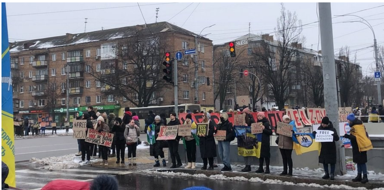
Manifestación en Kiev, el 11 de febrero, por la devolución de los prisioneros de guerra

A menudo, los participantes tenían familiares que habían sido hechos prisioneros por los rusos y exigían que hubiera más intercambios de prisioneros. Pidieron a la sociedad ucraniana que no se olvidara de ellos. Por ejemplo, el domingo 14 de enero de 2024 se organizó en Dnipro una concentración en apoyo a los prisioneros de guerra. En la plaza Slobozhansk, unas cien personas salieron con carteles pidiendo el regreso de sus seres queridos del cautiverio ruso. En Kiev, 300 personas acudieron a recordar una vez más a la sociedad y a las autoridades que llevan casi dos años esperando el regreso de sus seres queridos del cautiverio ruso, y 120 en Mykolaiv. También se celebraron concentraciones en Odesa (30 participantes), Cherkassy (100), Potlava (30), Soumy (20) y Khmelnytsky (una manifestación callejera de 23 mujeres).