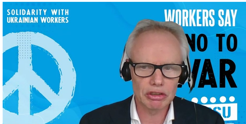
El Secretario General de la FSESP, Jan Willem Goudriaan

Durante estos 730 días de guerra, más de 10 millones de ucranianos se han visto desplazados, ya sea dentro del país o como refugiados internacionales. Muchos miles de civiles y trabajadores de los servicios públicos han muerto en Ucrania, y muchos más han